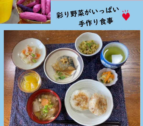
彩り野菜がいっぱい 手作り食事