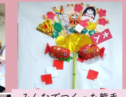
みんなでつくった熊手