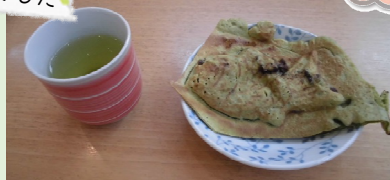
お土産に川根名物の「たい焼き」