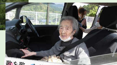
歌を歌ったり、景色を眺めて 会話ははずんだドライブでした