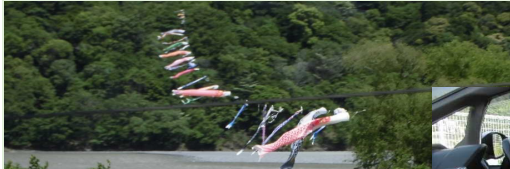
元気に泳いでる鯉のぼり