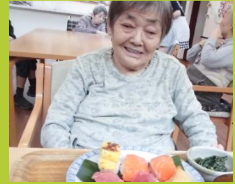
👋 握り寿司を作りました 🍣