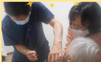
コロナワクチン接種終了