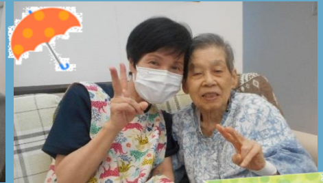
塗り絵をしたり、作品を作ったり