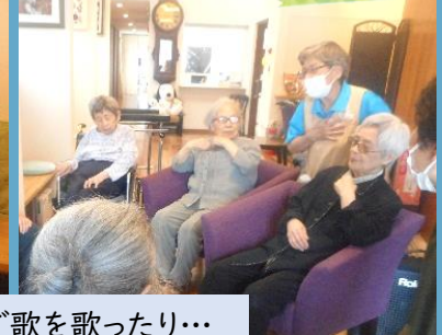
エンタランスで歌を歌ったり...