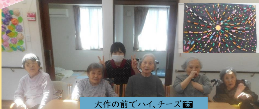
大作の前でハイ、チーズ 📷