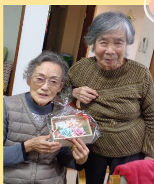
かわいい正月飾り 完成!!