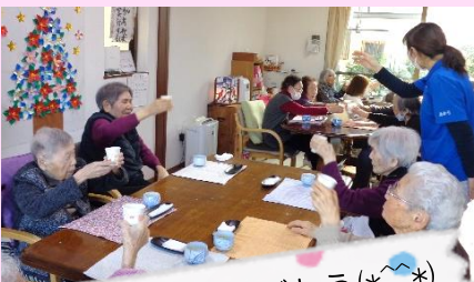
今年1年、ありがとう(*~*) かんぱーい!!