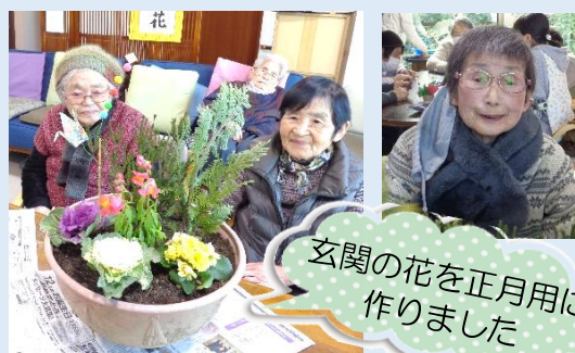
玄関の花を正月用に 作りました