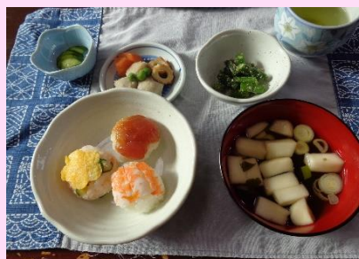
可愛くて、食べやすい てまり寿司